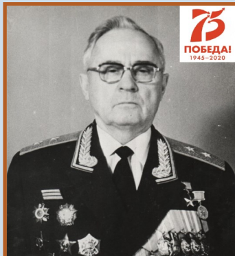
КОВТУНОВ ГЕОРГИЙ НИКИТОВИЧ Генерал-лейтенант