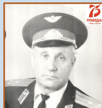
ГЛОТОВ НИКОЛАЙ ИВАНОВИЧ Полковник